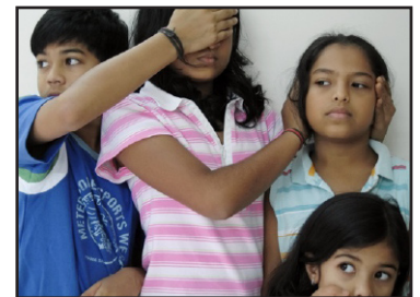
Untitled 2007 © Shilpa Gupta

Dans un contexte terroriste, tel que le connaît l'Inde actuellement, être musulman ou hindou a-t-il une incidence sur les mécanismes de la peur ? Et si la peur était la révélation de perceptions involontaires de notre système biologique ?